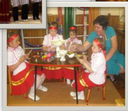
Фрагменты развлечения «Как казаки Пасху праздновали» МБДОУ № 11